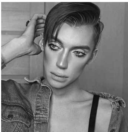
Личный блог, юмор