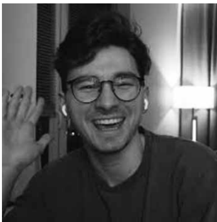
Личный блог, анонсы видео на ютуб