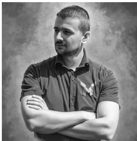
Личный блог, анонсы видео на ютуб