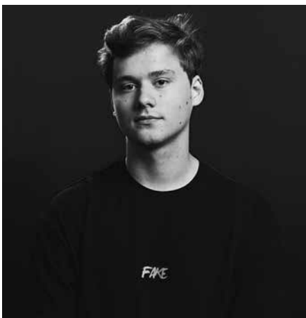
Личный блог, анонсы видео на ютуб