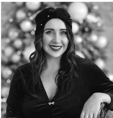
Личный блог, реклама